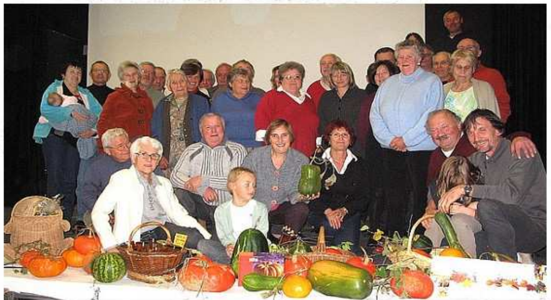
CUCURBITACÉES. Les adhérents de l'association et des potirons.

Les nombreuses cuisinières ont bien travaillé et réussi leurs différents plats, qui furent un régal pour tous. Avant de passer