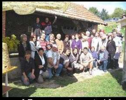
[ Envoyer cette carte ! ]