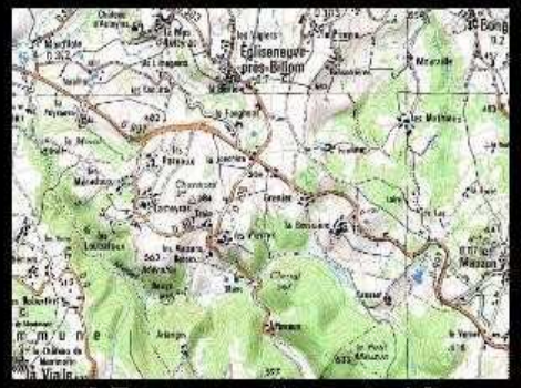
[ Envoyer cette carte ! ]