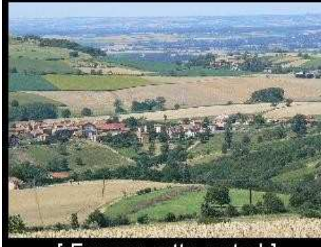
[ Envoyer cette carte ! ]