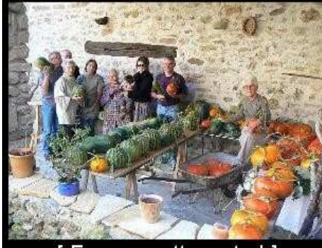
[ Envoyer cette carte ! ]