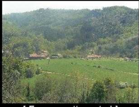
[ Envoyer cette carte ! ]