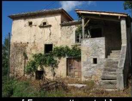
[ Envoyer cette carte ! ]