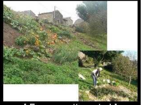
[ Envoyer cette carte ! ]