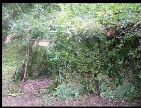
[ Envoyer cette carte ! ]