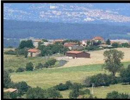
[ Envoyer cette carte ! ]