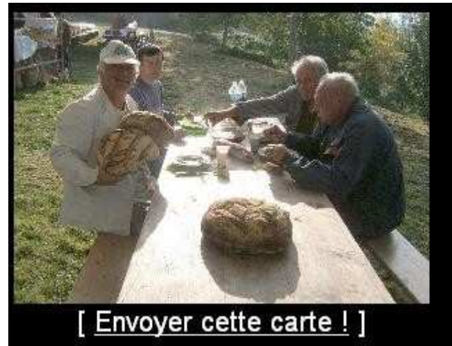
[ Envoyer cette carte ! ]