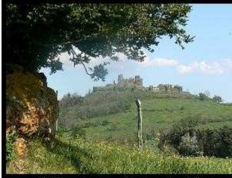
[ Envoyer cette carte ! ]