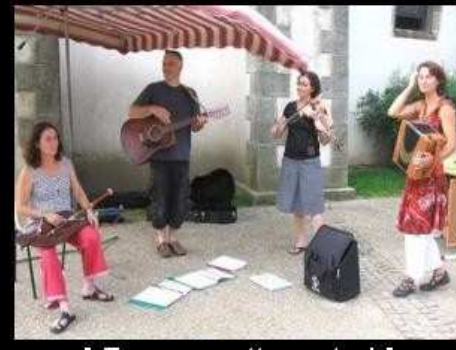
[ Envoyer cette carte ! ]