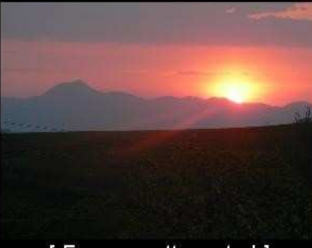
[ Envoyer cette carte ! ]