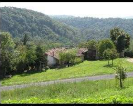
[ Envoyer cette carte ! ]