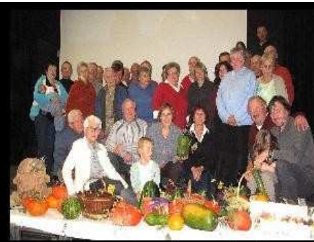
[ Envoyer cette carte ! ]