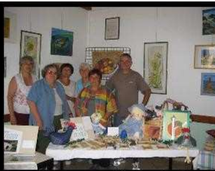
[ Envoyer cette carte ! ]