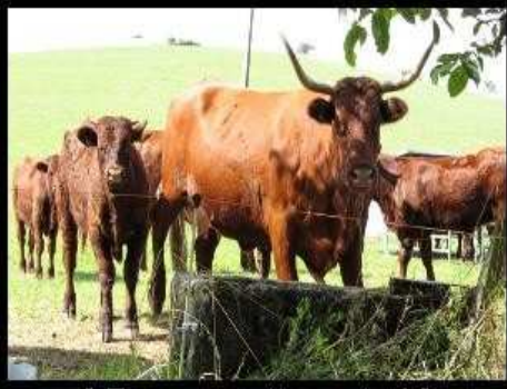
[ Envoyer cette carte ! ]