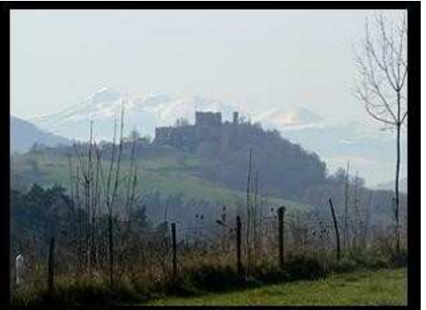
[ Envoyer cette carte ! ]