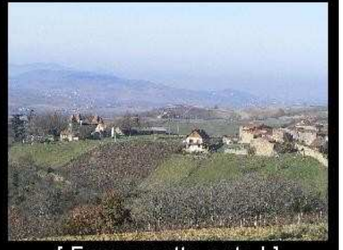
[ Envoyer cette carte ! ]