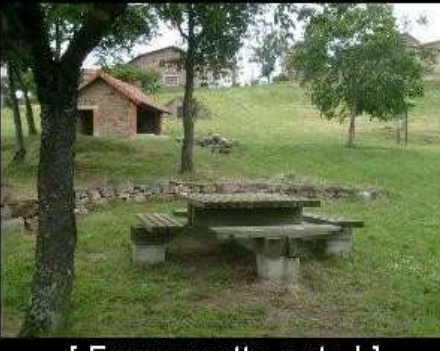
[ Envoyer cette carte ! ]